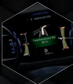
CENTRE D'AFFICHAGE DE L'INFORMATION DE 7 PO (LIVRABLE EN OPTION)

Le Gladiator soutient votre désir d'en « faire plus » grâce à la caméra 2 frontale (livrable en option) et à la caméra arrière (de série), un haut-parleur sans fil Bluetooth MP amovible livrable en option et des écrans couleur installés à l'avant et au centre, livrables en option. Le Gladiator vous permet de rester facilement en contact et diverti.