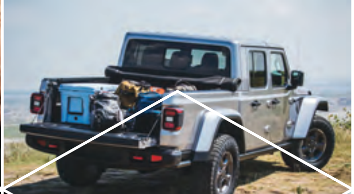
Bien arrimer le chargement.