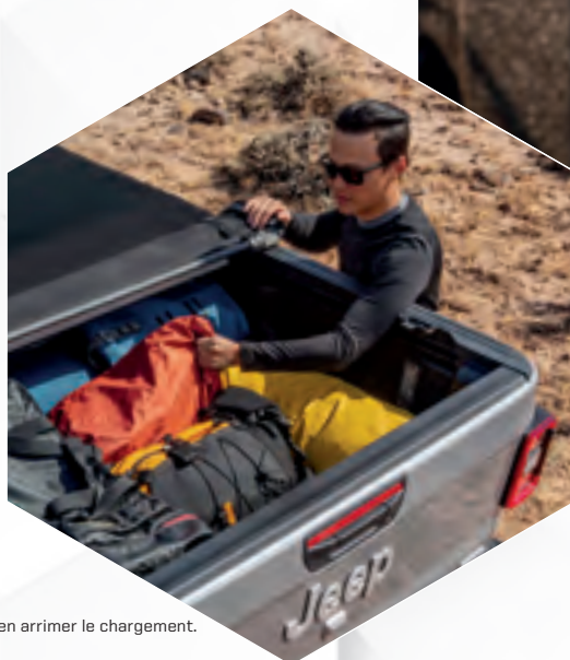
Bien arrimer le chargement.