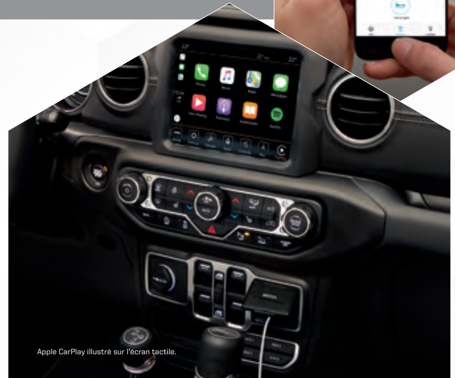
Apple CarPlay illustré sur l'écran tactile.

Affichez vos applications iPhone préférées sur l'écran tactile Uconnect 20 . Accédez à votre bibliothèque iTunes, appelez une personne dans votre liste de contacts ou demandez simplement à Siri 21 de vous aider pendant que vous conduisez. Obtenez un itinéraire, passez des appels, envoyez des messages et connectez-vous à Apple Music tout en roulant. Livrable en option.