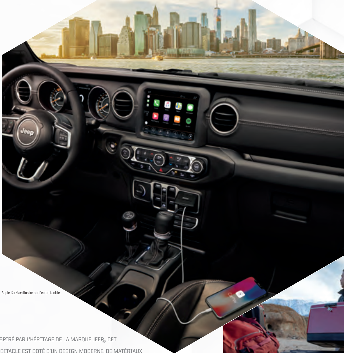
Apple CarPlay illustré sur l'écran tactile.

INSPIRÉ PAR L'HÉRITAGE DE LA MARQUE JEEP®, CET HABITACLE EST DOTÉ D'UN DESIGN MODERNE, DE MATÉRIAUX HAUT DE GAMME ET ROBUSTES, D'UNE PANOPLIE DE COMMODITÉS ET DES PLUS RÉCENTES NOUVEAUTÉS TECHNOLOGIQUES INCONTOURNABLES.