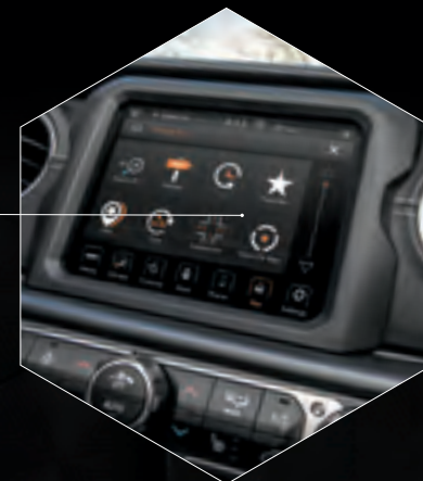
SYSTÈME UCONNECT TM 4C NAV AVEC ÉCRAN TACTILE DE 8,4 PO (LIVRABLE EN OPTION)